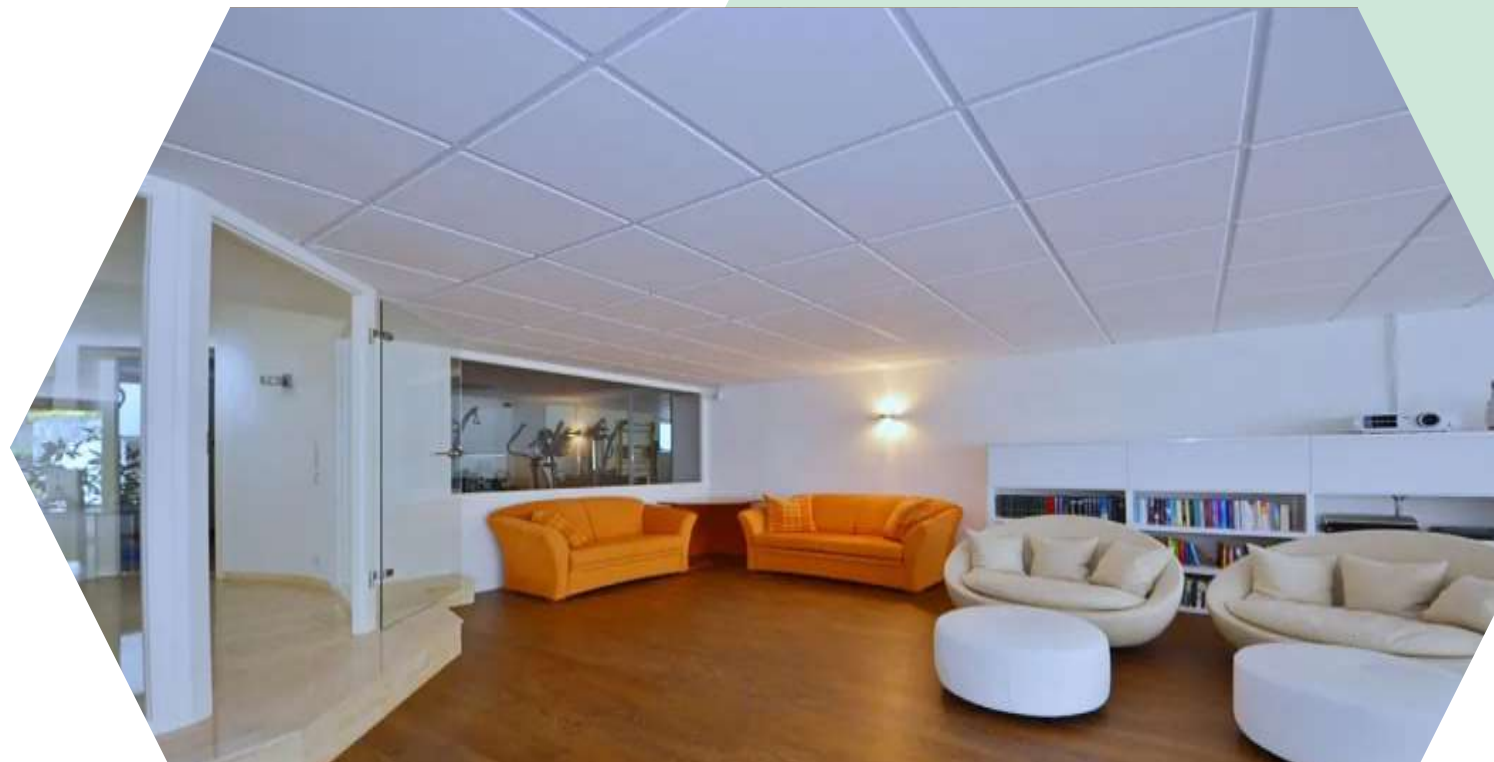
Salon Ebene Gym und Sauna :